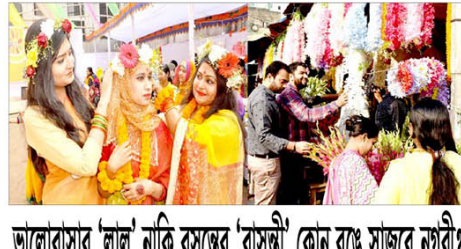
ভালোবাসার 'লাল' নাকি বসন্তের 'বাসন্তী' কোন রঙে সাজবে নগরী?

শীতলক্ষ্যা রিপোর্ট: এখার খানার দুই পুত্র পুত্র আবারও তাকে হারিয়ে ফেলে নিশে যায়। এবং হারিয়ে ফেলার তদাবল করে রাখেন। পরে আওয়ামী লীগ নেতারা মৃতদেহ নিয়ে তাকে ছাড়িয়ে আনেন।