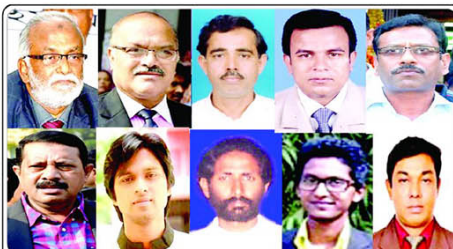
নারায়ণগঞ্জ সদর উপজেলা নির্বাচন প্রসঙ্গে বিএনপি